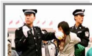
人们说真话的权利被剥夺

都不是。法轮功学员的选择是和平地、意志如钢地坚守着自己的信念。他们吃尽难以想象的炼狱般的痛苦，却仍以大善大忍