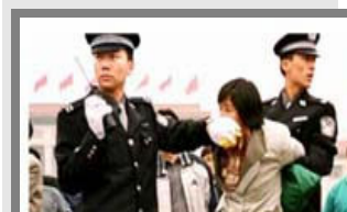
人们说真话的权利被剥夺

都不是。法轮功学员的选择是和平地、意志如钢地坚守着自己的信念。他们吃尽难以想象的炼狱般的痛苦，却仍以大善大忍