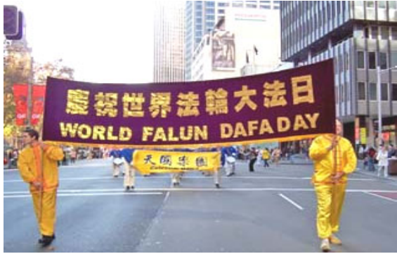
2006 年 5 月 13 日，澳大利亚举行 第七届世界法轮大法日庆典。

2006 年 5 月 13 日是法轮大法创始人李洪志先生传法 14 周年的日子暨第七届“世界法轮大法日”同时，5 月 13 日也是法轮功创始人李洪志先生华诞。