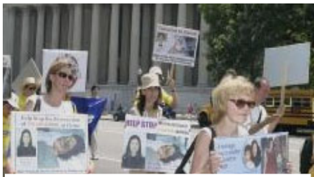
美国首府“7·20”反迫害大游行

现在中国大多数老百姓包括中国国安、公安警察内部普遍同情法轮功，谴责江氏暴行。江泽民耗费四分之一综合国力维持对法轮功群众的镇压，在政府内