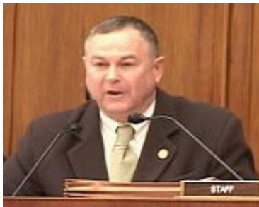
国会议员德纳·罗拉巴克

在此之前，美国众议院外交关系委员会监督调查小组委员会主席、国会议员德纳·罗拉巴克起草了一封联署信给美国总统布什，信中指出：作为立