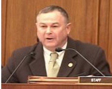
国会议员德纳·罗拉巴克

在此之前，美国众议院外交关系委员会监督调查小组委员会主席、国会议员德纳·罗拉巴克起草了一封联署信给美国总统布什，信中指出：作为立