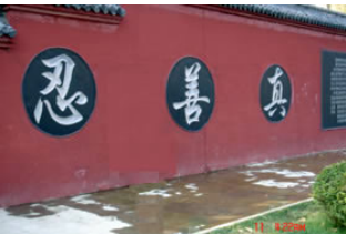
2006 年 1 月 26 日拍摄 (涂抹前)

龙泉寺始建于明泰元年（1450 年），是济南地区著名佛寺，位于百脉泉公园内。寺中的“龙泉”独具特色，享有“天下奇观”的美誉，特别是龙泉寺西墙壁上直径 1 米左右的圆圈中雕刻的“真，善，忍，精，气，神”六个大字，更是吸引着海内外的大量游客，也给济南旅游业带来经济效益。可这好端端的字为什么要涂掉呢？