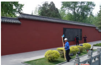
2006 年 5 月 2 日拍摄 (涂抹后)

原来是原中共头子江××五一期间要来龙泉寺游玩，为了迎接江××，4 月中旬山东省政府拨专款 4—5 亿元重修百脉泉公园。据园内职工说：市领导指示，“真，善，忍”是法轮功的