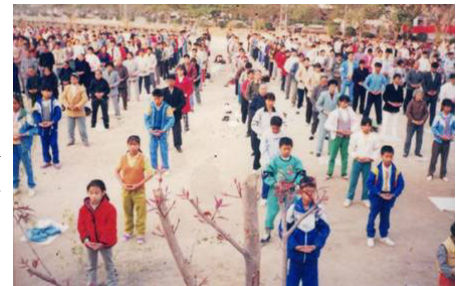
电白县学员99年4·25前集体炼功

1995年3月和5月，李洪志先生应邀到法国和瑞典传功讲法，开始了法轮大法在海外的传播，也使各国人