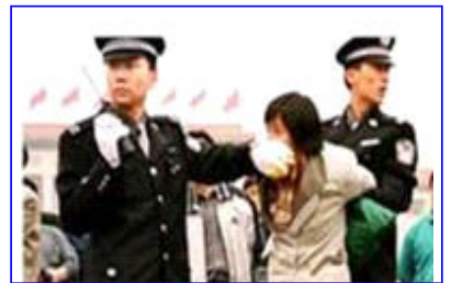
人们说真话的权利被剥夺了