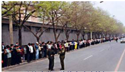
▲ 法轮功学员静静在路边等候，秩序井然。两名警察在一旁聊天。

◆ 4. 25 当晚，江 XX 出于妒忌，强行推翻政府总理的开明决定。之后在媒体宣传中，把 4. 25 法轮功学员去信访办（位于中南海西侧）和平上访，歪曲成“围攻中南海”，扣上了“政治事件”的帽子，并于 1999 年 7 月在中国发动了对法轮功的全面迫害。◇