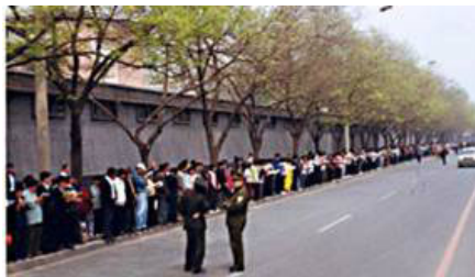
▲ 法轮功学员静静在路边等候，秩序井然。两名警察在一旁聊天。

◆ 4. 25 当晚，江 XX 出于妒忌，强行推翻政府总理的开明决定。之后在媒体宣传中，把 4. 25 法轮功学员去信访办（位于中南海西侧）和平上访，歪曲成“围攻中南海”，扣上了“政治事件”的帽子，并于 1999 年 7 月在中国发动了对法轮功的全面迫害。◇