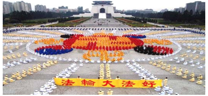
2005年12月4000多名台湾法轮功学员在台北广场排法轮图形

真善忍的伟大力量将被永世传颂，在佛法真理的感召下，必会有更多的生命在精神的回归过程中升华，就让我们共同见证这伟大的历史瞬间吧！