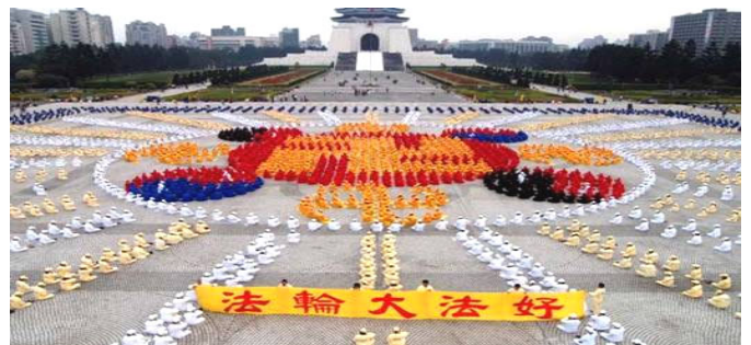
2005年12月4000多名台湾法轮功学员在台北广场排法轮图形

真善忍的伟大力量将被永世传颂，在佛法真理的感召下，必会有更多的生命在精神的回归过程中升华，就让我们共同见证这伟大的历史瞬间吧！