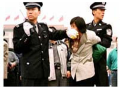
人们说真话的权利被剥夺了