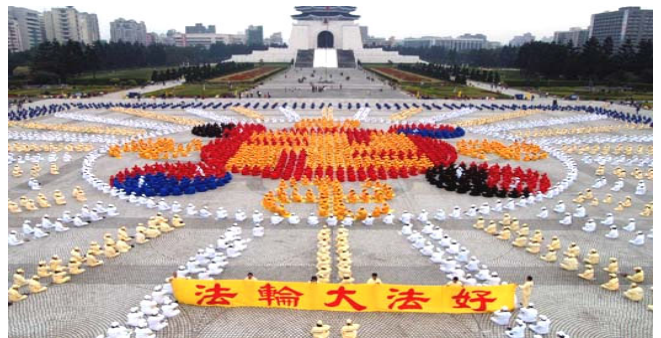
2005年12月 4000多名台湾法轮功学员在台北广场排法轮图形

真善忍的伟大力量将被永世传颂，在佛法真理的感召下，必会有更多的生命在精神的回归过程中升华，就让我们共同见证这伟大的历史瞬间吧！