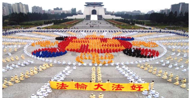
2005年12月 4000多名台湾法轮功学员在台北广场排法轮图形

真善忍的伟大力量将被永世传颂，在佛法真理的感召下，必会有更多的生命在精神的回归过程中升华，就让我们共同见证这伟大的历史瞬间吧！