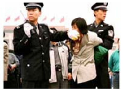
人们说真话的权利被剥夺了