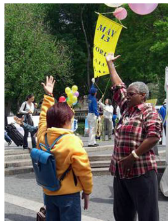
美国纽约民众在学功 (2006 年 5 月 13 日)

为你祝福， 为你而来， 我把真心向你敞开， 我把真相向你呈献—— 大法可贵， 万世机缘。◇