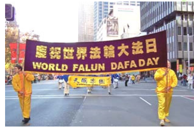
2006 年 5 月 13 日，澳大利亚举行第七届世界法轮大法日庆典。

2006 年 5 月 13 日是法轮大法创始人李洪志先生传法 14 周年的日子暨第七届“世界法轮大法日”同时，5 月 13 日也是法轮功创始人李洪志先生华诞。