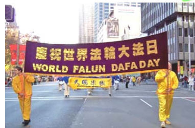
2006 年 5 月 13 日，澳大利亚举行第七届世界法轮大法日庆典。

2006 年 5 月 13 日是法轮大法创始人李洪志先生传法 14 周年的日子暨第七届“世界法轮大法日”同时，5 月 13 日也是法轮功创始人李洪志先生华诞。