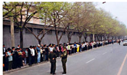
▲ 法轮功学员静静在路边等候，秩序井然。两名警察在一旁聊天。

◆ 4.25当晚，江XX出于妒忌，强行推翻政府总理的开明决定。之后在媒体宣传中，把4.25法轮功学员去信访办（位于中南海西侧）和平上访，歪曲成“围攻中南海”，扣上了“政治事件”的帽子，并于1999年7月在中国发动了对法轮功的全面迫害。