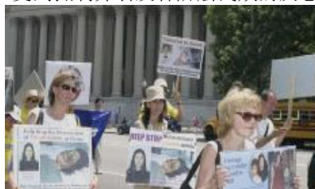
美国首府“7·20”反迫害大游行

现在中国大多数老百姓包括中国国安、公安警察内部普遍同情法轮功，谴责江氏暴行。江泽民耗费四分之一综合国力维持对法轮功群众的镇压，在政府内受到抵制并引发各阶层民众的反感。