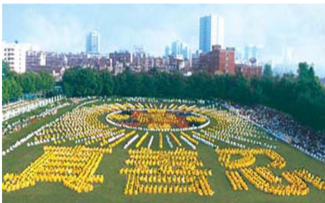
湖北省武汉市，5000多法轮功学员集体炼功，组排“法轮图形”和“真善忍”（1997）

1995年1月法轮功主要著作《转法轮》由中国广播电视出版社出版发行，《转法轮》自出版后一直供不应求，1996年1月被《北京青年报》列入北京市十大畅销书。