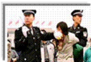
人们说真话的权利被剥夺

都不是。法轮功学员的选择是和平地、意志如钢地坚守着自己的信念。他们吃尽难以想象的炼狱般的