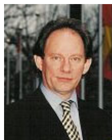
麦克米兰·史考特先生

席爱德华·麦克米兰·史考特 (McMillan-Scott) 2006年5月21日赴北京，对中国的人权实况亲自进行了为期3天的调查。他在北京曾与一些法轮功学员会面，了解他们受迫害的情况。此外，他还会见了不少外交官、专家、学者、非政府组织和人士。