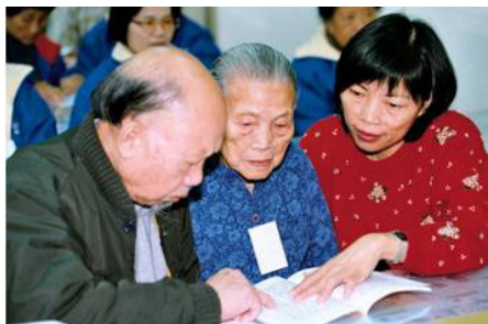
台湾老人学《转法轮》

健康的身体,对于老人和他们儿女,无疑是老来得宝了。下面是台湾屏东三位老人与您分享的“得宝故事”。