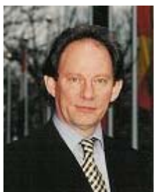
麦克米兰·史考特先生

【明慧网 2006 年 5 月 26 日】欧盟议会副主席爱德华·麦克米兰·史考特 (McMillan-Scott) 2006 年 5 月 21 日赴北京，对中国的人权实况亲自进行了为期 3 天的调查。他在北京曾与一些法轮功学员会面，了解他们受迫害的情况。此外，他还会见了不少外交官、专家、学者、非政府组织和人士。