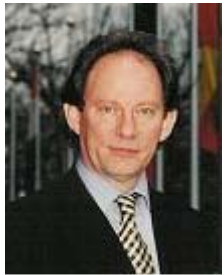
麦克米兰·史考特先生

【明慧网 2006 年 5 月 26 日】欧盟议会副主席爱德华·麦克米兰·史考特 (McMillan-Scott) 2006 年 5 月 21 日赴北京，对中国的人权实况亲自进行了为期 3 天的调查。他在北京曾与一些法轮功学员会面，了解他们受迫害的情况。此外，他还会见了不少外交官、专家、学者、非政府组织和人士。