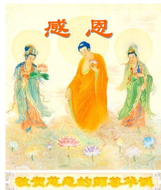
中国大陆法轮功学员绘画： 慈悲洒甘露

【明慧网】李洪志老师当年在中国传大法，千辛万苦，走遍了长城内外、大江南北。大法的美好神奇象磁石一样吸引了千千万万个有缘人，从全国各地赶来聆听李老师的亲自传功讲法。李老师每到一处办班除了本地学员，还有一群跟着李老师走的“跟班”学员，李老师走到哪里就跟到哪里。每当学习班要结束，学员都恋恋不舍，都想在李老师身边多呆一刻，这一刻是多么