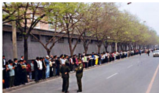
▲ 法轮功学员静静在路边等候，秩序井然。两名警察在一旁聊天。

◆ 晚上学员们散去时，地上一片纸屑都没有，连警察扔的烟头都给捡起来了。法轮功学员的和平