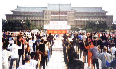
长春法轮功学员集体炼功盛况

1992 年 5 月 13 日，李洪志先生于长春开办了第一期学习班，将法轮大法公诸于世。法轮大法以宇宙特性“真善忍”指导人修心向善，从根本上祛除病疾、净化身心灵，使真修者最终达到返本归真的境界。从那时开始到 1994 年 12 月，李洪志先生先后由各地官方气功科学研究会邀请，在中国举办 54 个讲法面授班，学员几十万人。至 1999 年短短 7 年，由于其神奇的功效，人传人，心传心，修者