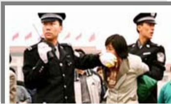
人们说真话的权利被剥夺了

大陆法轮功学员冒着生命危险，去上访、到天安门请愿、散发真相资料、插播电视，向人民讲清法轮功被迫害的真相，为法轮功正名。