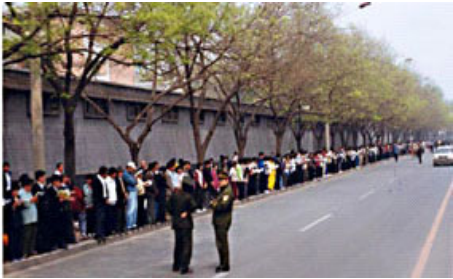
▲ 法轮功学员静静在路边等候，秩序井然。两名警察在一旁聊天。

◆ 4.25 当晚，江 XX 出于妒忌，强行推翻政府总理的开明决定。之后在媒体宣传中，把 4.25 法轮功学员去信访办（位于中南海西侧）和平上访，歪曲成“围攻中南海”，扣上了“政治事件”的帽子，并于 1999 年 7 月在中国发动了对法轮功的全面迫害。◇