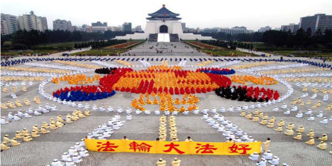
2005 年 12 月 4000 多名台湾法轮功学员在台北中正纪念堂广场前排法轮图形

真善忍的伟大力量将被永世传颂，在佛法真理的感召下，必会有更多的生命在精神的回归过程中升华，就让我们共同见证这伟大的历史瞬间吧！