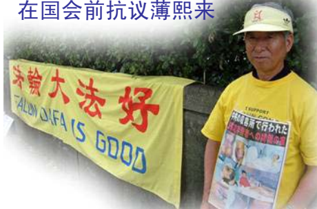
图：近70岁的伊贺老人在国会前抗议薄熙来

据统计，薄在担任辽宁省长期间，至少有103名法轮功学员被迫害致死。有多名证人揭露位于沈阳苏家屯的集中营自2001年起活体摘取法轮功学员的器官。◇