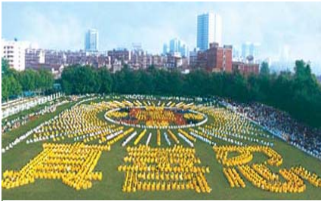
湖北省武汉市，5000多法轮功学员集体炼功，组排“法轮图形”和“真善忍”（1997）

1995年1月法轮功主要著作《转法轮》由中国广播电视出版社出版发行，《转法轮》自出版后一直供不应求，1996年1月被《北京青年报》列入北京市十大畅销书。