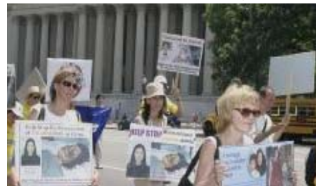
美国首府“7·20”反迫害大游行

现在中国大多数老百姓包括中国国安、公安警察内部普遍同情法轮功，谴责江氏暴行。江泽民耗费四分之一综合国力维持对法轮功群众的镇压，在政府内受到抵制并引发各阶层民众的反感。