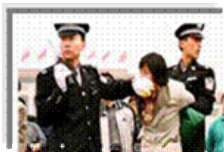
人们说真话的权利被剥夺