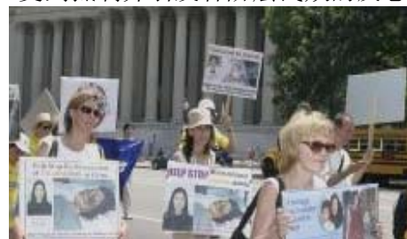
美国首府“7·20”反迫害大游行

现在中国大多数老百姓包括中国国安、公安警察内部普遍同情法轮功，谴责江氏暴行。江泽民耗费四分之一综合国力维持对法轮功群众的镇压，在政府内受到抵制并引发各阶层民众的反感。