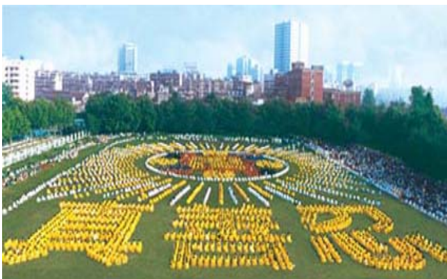
湖北省武汉市，5000多法轮功学员集体炼功，组排“法轮图形”和“真善忍”（1997）

1995年1月法轮功主要著作《转法轮》由中国广播电视出版社出版发行，《转法轮》自出版后一直供不应求，1996年1月被《北京青年报》列入北京市十大畅销书。