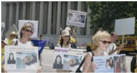
美国首府“7·20”反迫害大游行

中国大陆法轮功学员冒著被抓捕、坐牢、生命危险，通过面对面交谈、写信、上访、发传单、打横幅、电视插播等各种方式向各级政府官员和民众讲述法轮功和受迫害的事实真相。