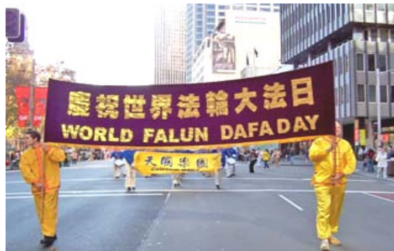
2006 年 5 月 13 日，澳大利亚举行 第七届世界法轮大法日庆典。

2006 年 5 月 13 日是法轮大法创始人李洪志先生传法 14 周年的日子暨第七届“世界法轮大法日”同时，5 月 13 日也是法轮功创始人李洪志先生华诞。