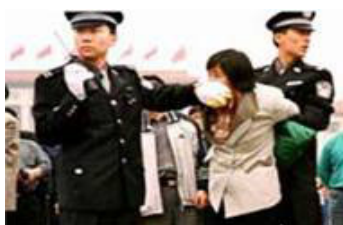
人们说真话的权利被剥夺