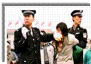
人们说真话的权利被剥夺

都不是。法轮功学员的选择是和平地、意志如钢地坚守着自己的信念。他们吃尽难以想象的炼狱般的