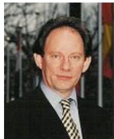
麦克米兰·史考特先生

【明慧网 2006 年 5 月 26 日】欧盟议会副主席爱德华·麦克米兰·史考特