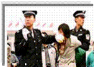
人们说真话的权利被剥夺

都不是。法轮功学员的选择是和平地、意志如钢地坚守着自己的信念。他们吃尽难以想象的炼狱般的