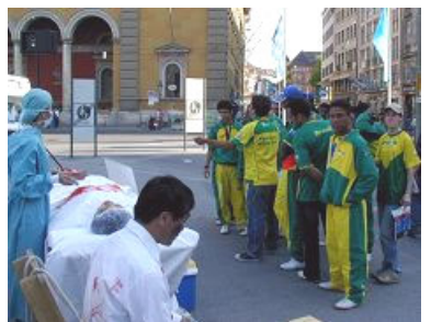
导游正给巴西球迷翻译展板内容

2006年世界杯足球赛于6月9日在德国巴伐利亚首府慕尼黑拉开序幕。慕尼黑市内的王宫和国家剧院的广场前，法轮功学员的炼功、真人模拟酷刑、活体摘取器官演示，引起游客的注意，很多人驻足观看。