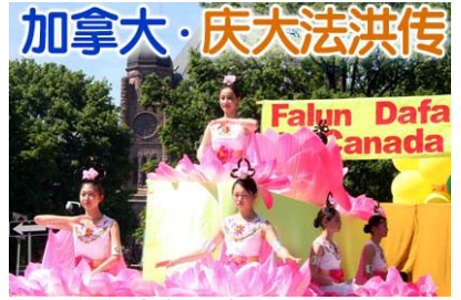
仙女在花车上演示法轮功功法

2006年5月27日，两千多位来自世界各地的法轮功学员在加拿大多伦多市举行盛大集会和游行，庆祝法轮大法洪传世界14周年，同时呼吁制止中共对法轮功的迫害。