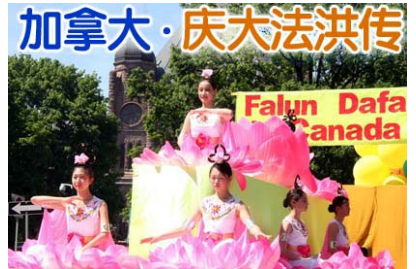
仙女在花车上演示法轮功功法

2006年5月27日，两千多位来自世界各地的法轮功学员在加拿大多伦多市举行盛大集会和游行，庆祝法轮大法洪传世界14周年，同时呼吁制止中共对法轮功的迫害。