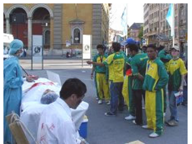
导游正给巴西球迷翻译展板内容

2006年世界杯足球赛于6月9日在德国巴伐利亚首府慕尼黑拉开序幕。慕尼黑市内的王宫和国家剧院的广场前，法轮功学员的炼功、真人模拟酷刑、活体摘取器官演示，引起游客的注意，很多人驻足观看。