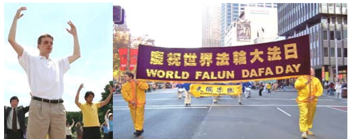
2006 年 5 月 13 日，澳大利亚举行 第七届世界法轮大法日庆典。

法轮大法，自 1992 年 5 月传出，至今，法轮大法已洪传世界近 80 个国家和地区，受到世界人民的喜爱。上亿人修炼法轮功。修炼者按照“真、善、忍”修心向善，获得了健康的身体和高尚的道德。