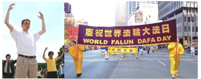
2006 年 5 月 13 日，澳大利亚举行 第七届世界法轮大法日庆典。

法轮大法，自 1992 年 5 月传出，至今，法轮大法已洪传世界近 80 个国家和地区，受到世界人民的喜爱。上亿人修炼法轮功。修炼者按照“真、善、忍”修心向善，获得了健康的身体和高尚的道德。