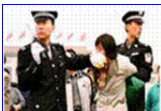
人们说真话的权利被剥夺

都不是。法轮功学员的选择是和平地、意志如钢地坚守着自己的信念。他们吃尽难以想象的炼狱