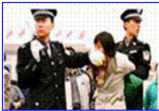
人们说真话的权利被剥夺

都不是。法轮功学员的选择是和平地、意志如钢地坚守着自己的信念。他们吃尽难以想象的炼狱