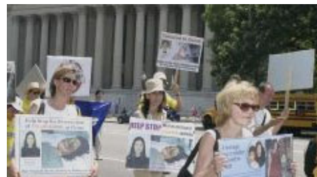
美国首府“7·20”反迫害大游行

现在中国大多数老百姓包括中国国安、公安警察内部普遍同情法轮功,谴责江氏暴行。江泽民耗费四分之一综合国力维持对法轮功群众的镇压,在政府内受到抵制并引发各阶层民众的反感。