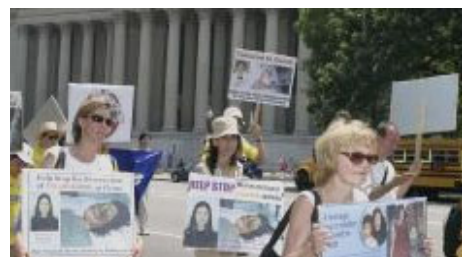
美国首府“7·20”反迫害大游行

现在中国大多数老百姓包括中国国安、公安警察内部普遍同情法轮功,谴责江氏暴行。江泽民耗费四分之一综合国力维持对法轮功群众的镇压,在政府内受到抵制并引发各阶层民众的反感。