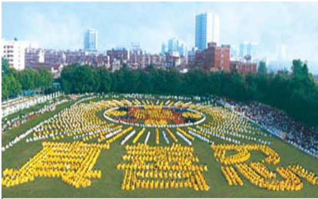
湖北省武汉市，5000多法轮功学员集体炼功，组排“法轮图形”和“真善忍”（1997）

1995年1月法轮功主要著作《转法轮》由中国广播电视出版社出版发行，《转法轮》自出版后一直供不应求，1996年1月被《北京青年报》列入北京市十大畅销书。