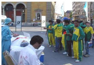
导游给巴西球迷翻译展板

今年3月，中共集中营活体摘取法轮功学员器官的黑幕被曝光，后来又有沈阳老军医指证全国类似的集中营有36个。证人指证活摘器官早在2000年就开始了，2001年到2003年达到高峰，现在罪恶还在继续。