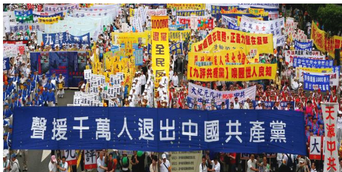
台湾各界声援大陆一千万民众退党