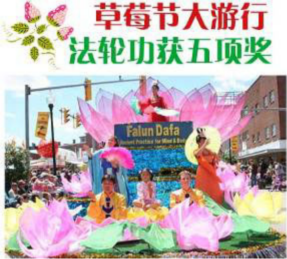
法轮功队伍的花车

2006年5月20日下午，美国数百名法轮功学员应邀参加了美国西弗吉尼亚州举行的“草莓节”庆典大游行，并荣获五项大奖：“庆典大游行专业花车第一名”、“草莓节青少年最喜爱的游行花车奖”、“西维州草莓节庆典最受主席欢迎奖”，学员的腰鼓队和军乐队分别荣获“音乐类游行团体”冠军和季军。