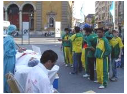
导游正给巴西球迷翻译展板内容

今年3月，中共集中营活体摘取法轮功学员器官的黑幕被曝光，后来又有沈阳老军医指证全国类似的集中营有36个。证人指证活摘器官早在2000年