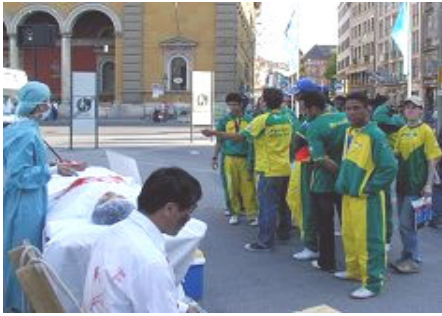
导游给巴西球迷翻译展板

今年 3 月，中共集中营活体摘取法轮功学员器官的黑幕被曝光，后来又有沈阳老军医指证全国类似的集中营有 36 个。证人指证活摘器官早在 2000 年就开始了，2001 年到 2003 年达到高峰，现在罪恶还在继续。