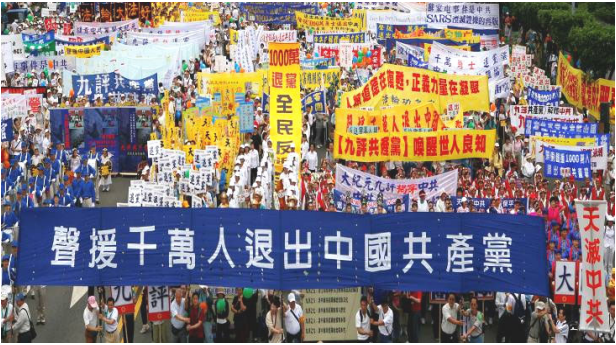
台湾各界声援大陆一千万民众退党