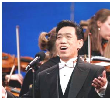
在全球华人新年晚会上演出 (纽约无线电音乐城, 2006年)