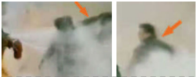
1,刘头部受重击 . 2,打击者仍保持用力姿势

“还有一件事更让人怀疑，大概是自焚后的几天（记不清了），警察去春玲家搜查，我和那几家邻居都在场，大家都很惊奇的是，警察从