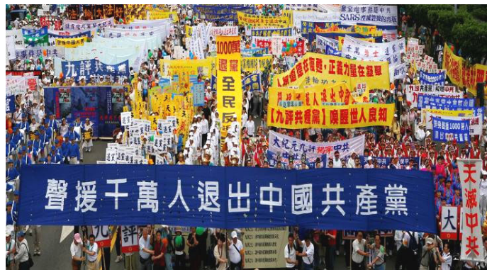
台湾各界声援大陆一千万民众退党

● 明慧广播电台 目前使用三个短波频率，每天播出三次，每次一小时。分别为北京时间，早6点-7点，7105千赫；晚9点-10点，6030千赫；晚11点-12点，11700千赫。听众还可登陆明慧广播电台网 http://www.mhradio.org ，收听、下载节目。