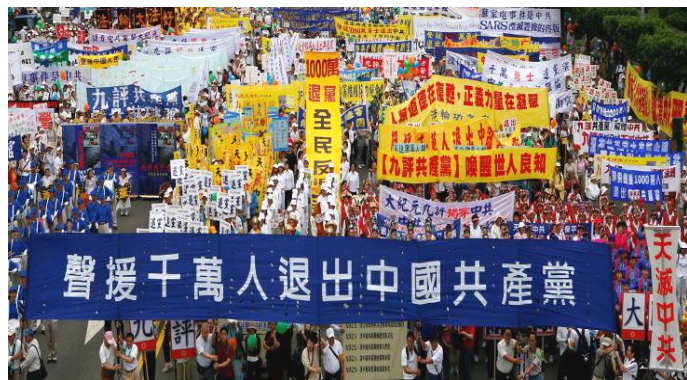
台湾各界声援大陆一千万民众退党

● 明慧广播电台 目前使用三个短波频率，每天播出三次，每次一小时。分别为北京时间，早6点-7点，7105千赫；晚9点-10点，6030千赫；晚11点-12点，11700千赫。听众还可登陆明慧广播电台网 http://www.mhradio.org ，收听、下载节目。