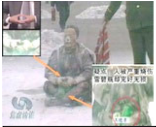
假王进东后面站着警察拿着灭火毯准备灭火

有一位法轮功学员给一位陌生人讲真相谈到天安门自焚时，该路人说，这事你没有我清楚，当时我在北京打工，发生自焚的当天我正好就在天安门广场，当时看到一辆汽车拉着一群人，头上蒙着黑布，到达广场，去掉黑布，开始执行导演的命令，点火时警察一手拿着打火机，一手拿着灭火器。