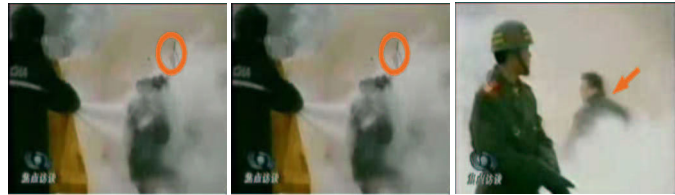
1. 刘头部受重击 2. 击打后飞出的重物 3. 打者保持用力姿势

见证一：吉林白山市露水河一老板的儿子，2001 年利用农历新年假期到北京玩，在天安门城楼上突然看见有人身上着火，在广场内四处跑动，有警察跟着跑，他看见有一个女的被一个警察用一棒状的物体狠命的砸在头上，那个女的随即倒在地上，又过去一个警察用一条白毛巾盖在那个女的头上。倒在地上的那个女的一动也没动过。过了好一会来了几个警察把那个女的抬到了车上。