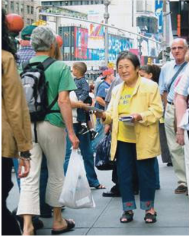
停一下你匆匆的脚步吧

目前，一些不明真相的世人面对法轮功学员讲真相的活动时，不顾法轮功学员的一心劝善，或不屑一顾拒绝真相，更有甚者恶语相向，他们即将失去的就是无比珍贵的机缘，而那机缘正是生命走向未来的金钥匙。◇