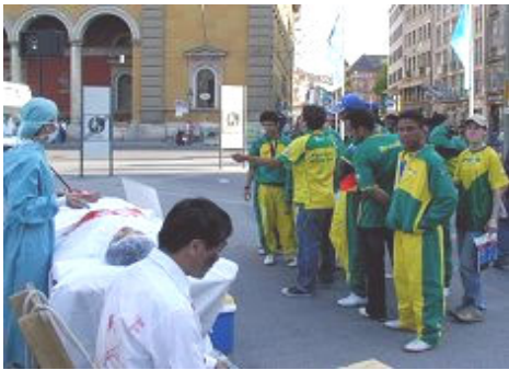
导游正给巴西球迷翻译展板内容

2006 年世界杯足球赛于 6 月 9 日在德国巴伐利亚首府慕尼黑拉开序幕。慕尼黑市内的王宫和国家剧院的广场前，法轮功学员的炼功、真人模拟酷刑、活体摘取器官演示，引起游客的注意，很多人驻足观看。