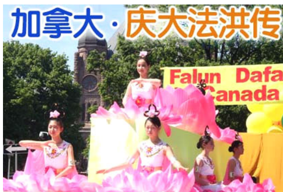
仙女在花车上演示法轮功功法