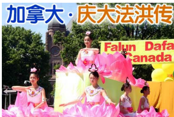
仙女在花车上演示法轮功功法