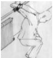
将人双手背扣在管子上，使人站不直，蹲不下

市公安局曹锦辉那些邪恶之徒，见我又活过来了，它们不但不知悔改，反而变本加厉。2002年9月的一天，它们又绑架了我。第二天在没办任何手续的情况下，把我和三名大法修炼者送到了臭名昭著的王村劳教所。强制洗脑，不转化，不让睡觉的。