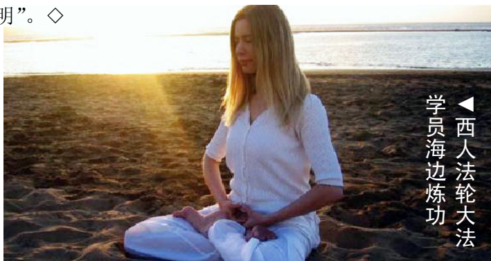
西人法轮大法 学员海边炼功

学法后按“真善忍”要求做，我自私的个性有很明显的改变，同事都说我整个人变了，个性柔顺、不争、不计较、也不去招惹是非了。随着心性的提高，单位、家庭和周围的气氛也跟着随之变的柔和，这让我体悟到了师父说的“佛光普照、礼义圆明”。◇