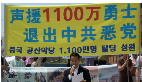
韩国民众声援 1100 万人退出中共

多的人看清了恶党的本质、相信“天要灭中共，退党保平安”，至今已有 1100 万民众声明退出了党团队，谁还愿意主动加入它呢？（文/田英）◇