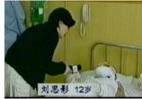
气管切开还能说、唱？记者采访不穿防护服，不戴口罩