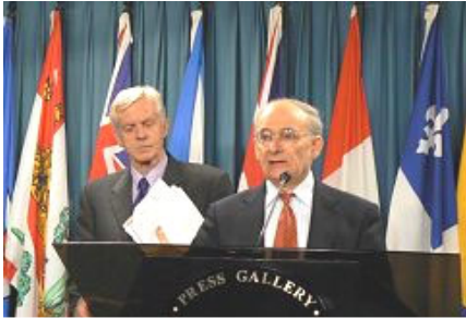
国际人权律师麦塔斯(讲话者)和乔高在新闻发布会上

2006年7月6日由加拿大前亚太司司长、资深国会议员大卫·乔高和国际人权律师大卫·麦塔斯组成的独立调查组,向加拿大媒体公开了