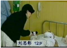
气管切开还能说、唱？记者采访不穿防护服，不戴口罩