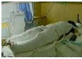
央视《焦点访谈》中的“自焚者”被包裹得严密。

◆ 大面积烧伤病人的创伤面本应尽量暴露，不能用药布包裹烧伤部位，但电视上的“自焚”者却全身包裹严密，丝毫不符合基本的医学常识。