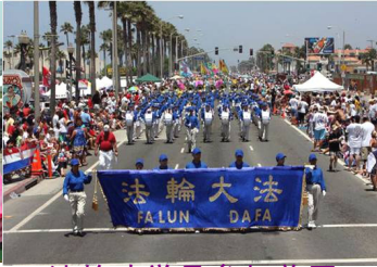
法轮功学员参加美国西部规模最大的国庆游行

一路上，观众们对法轮功学员精心准备，展现法轮大法美好殊胜的花车赞不绝口，而轻柔、缓慢的功法表演也成为游行的一个焦点。