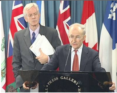
麦塔斯（右）和乔高 在新闻发布会上