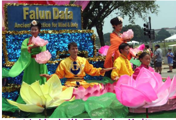
法轮功学员参加首都华盛顿的独立日大游行

国各地举办的国庆游行。在各地的游行队伍中，法轮功的花车和“天国乐团”的表演深受欢迎。