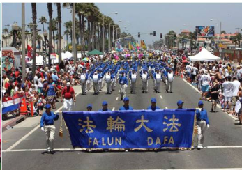
法轮功学员参加美国西部规模最大的国庆游行

一路上，观众们对法轮功学员精心准备，展现法轮大法美好殊胜的花车赞不绝口，而轻柔、缓慢的功法表演也成为游行的一个焦点。