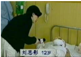
气管切开还能说、唱？记者采访不穿防护服，不戴口罩