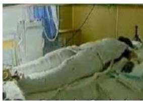
央视《焦点访谈》中的“自焚者”被包裹得严密。

◆ 大面积烧伤病人的创伤面本应尽量暴露，不能用药布包裹烧伤部位，但电视上的“自焚”者却全身包裹严密，丝毫不符合基本的医学常识。