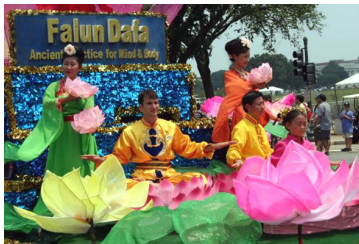
法轮功学员参加首都华盛顿的独立日大游行

国各地举办的国庆游行。在各地的游行队伍中，法轮功的花车和“天国乐团”的表演深受欢迎。