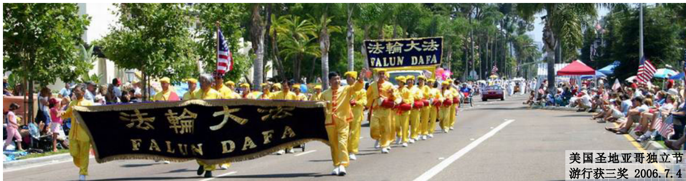
美国圣地亚哥独立节游行获三等奖 2006. 7. 4