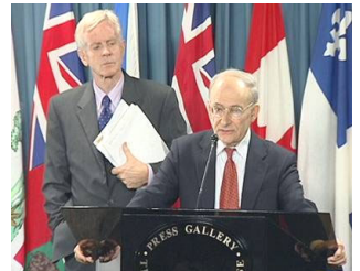
麦塔斯（右）和乔高在新闻发布会上

【明慧网】由加拿大前亚太司司长、资深国会议员大卫·乔高和国际人权律师大卫·麦塔斯组成的独立调查组 2006 年 7 月 6 日向加拿大媒体公开了“关于调查指控中共摘取法轮功学员器官的报告”。在当天的新闻发布会上，麦塔斯将活体摘取法轮功学员器官的行为称为“这个星球上前所未有的邪恶”。