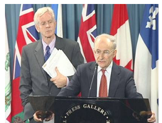
麦塔斯（右）和乔高在新闻发布会上

【明慧网】由加拿大前亚太司司长、资深国会议员大卫·乔高和国际人权律师大卫·麦塔斯组成的独立调查组 2006 年 7 月 6 日向加拿大媒体公开了“关于调查指控中共摘取法轮功学员器官的报告”。在当天的新闻发布会上，麦塔斯将活体摘取法轮功学员器官的行为称为“这个星球上前所未有的邪恶”。