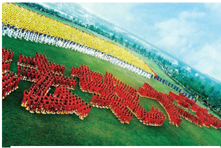
▲镇压前法轮功学员进行大规模的组字