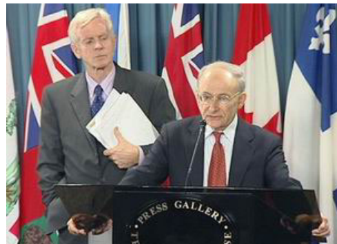
加前政要乔高和人权律师麦塔斯

【明慧网】加拿大前政要大卫·乔高和国际人权律师大卫·麦塔斯7月6日在渥太华向媒体公布了长达68页的“关于调查指控中共摘取法轮功学员