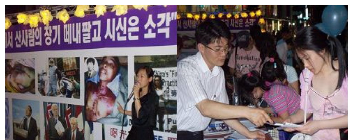
主持人向观众揭露中共对法轮功的残酷迫害

【明慧网】2006年7月8日傍晚,法轮功学员在韩国首都首尔最繁华的地段“明洞”举行了烛光悼念活动,旨在揭露中共盗取法轮功学员活体器官的暴行,悼念无辜被迫害致死的大陆同修。这场悼念活动是在7月6日加拿大独立调查团公布调查结果,证实中共对法轮功学员进行活体器官摘取的罪行确实存在的背景下举行的。虽然是盛夏,舞台四周人山人海的观众驻足观看揭露活体盗取器官的模拟演示。主持人呼吁人们,共同制止人类历史上这场最邪恶的迫害,解体制造无尽残酷暴行的中共;一起伸出援助之手,营救那些现在还被关押在集中营、劳教所内,随时面临被活体摘取器官的法轮功学员。