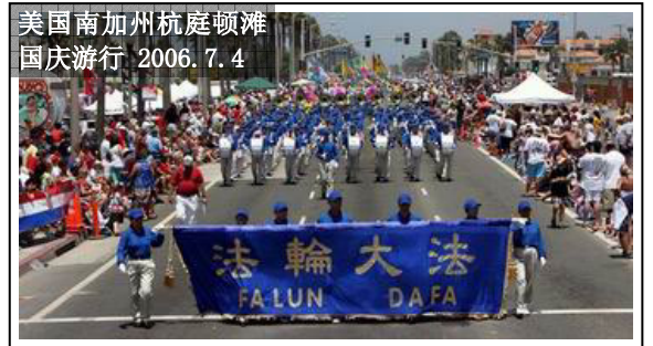
美国南加州杭庭顿滩 国庆游行 2006.7.4