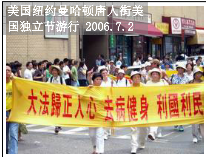
美国纽约曼哈顿唐人街美国 国独立节游行 2006.7.2