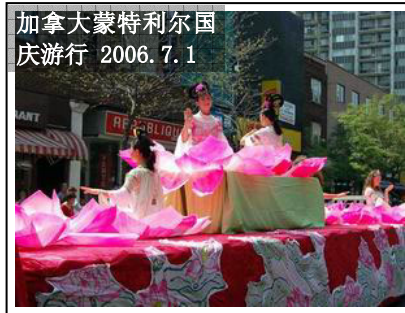
加拿大蒙特利尔国 庆游行 2006.7.1