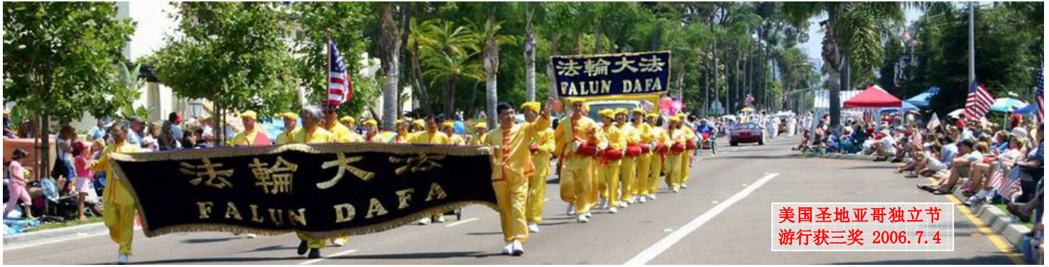
美国圣地亚哥独立节 游行获三奖 2006.7.4