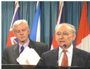
麦塔斯（讲话者）和乔高 在新闻发布会上