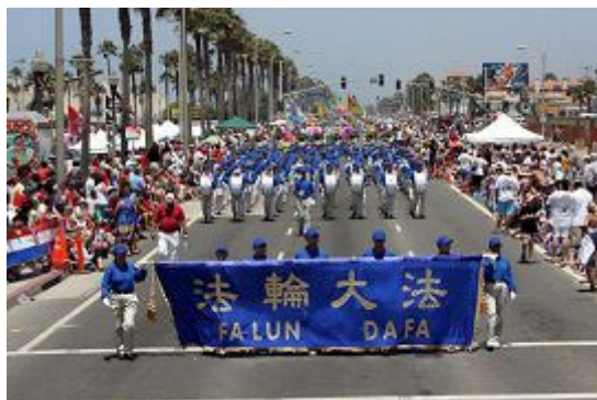
法轮功学员参加美国西部规模最大的节日游行