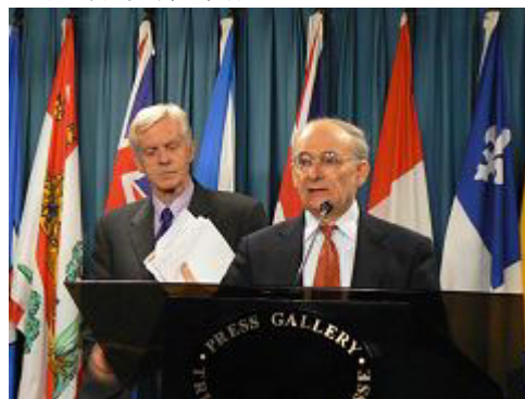
麦塔斯 (讲话者) 和乔高在新闻发布会上

【明慧网】由加拿大前亚太司司长、资深国会议员大卫·乔高 (David Kilgour) 和国际人权律师大卫·麦塔斯 (David Matas) 组成的独立调查组 2006 年 7 月 6 日向加拿大媒体公开了“关于调查指控中共摘取法轮功学员器官的报告”。在当天的新闻发布会上，麦塔斯将活体摘取法轮功学员器官的行为称为“这个星球上前所未有的邪恶”。