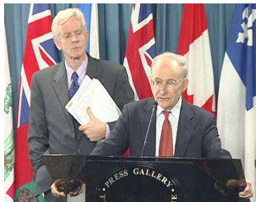
麦塔斯(右)和乔高在新闻发布会上

在当天的新闻发布会上,麦塔斯将活体摘取法轮功学员器官的行为称为 “这个星球上前所未有的邪恶” 。