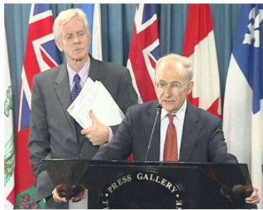
麦塔斯(右)和乔高在新闻发布会上

在当天的新闻发布会上,麦塔斯将活体摘取法轮功学员器官的行为称为 “这个星球上前所未有的邪恶” 。