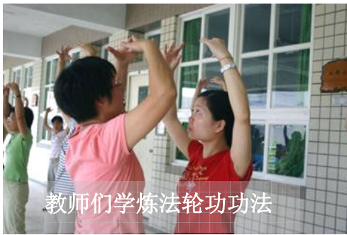
教师们学炼法轮功功法

年 7 月 10 日至 13 日，台湾 南桃园的 法轮功生 命教育教 师研习营 在平兴国