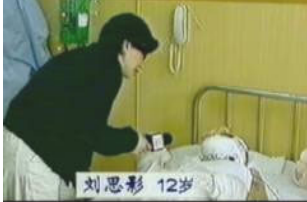
气管切开还能说、唱？记者采访不穿防护服，不戴口罩