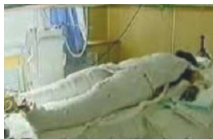
央视《焦点访谈》中的“自焚者”被包裹严密

瓶（图中箭头处）在高温火焰中，竟然完好无损。用最基本的生活常识判断就知道是在造假。