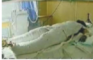
央视《焦点访谈》中的“自焚者”被包裹严密

瓶（图中箭头处）在高温火焰中，竟然完好无损。用最基本的生活常识判断就知道是在造假。