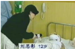
气管切开还能说、唱？记者采访不穿防护服，不戴口罩