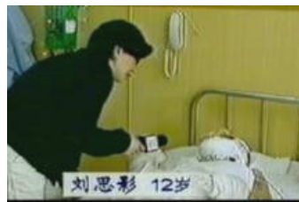
▲ 自焚者刘思影气管切开还能唱歌？记者采访不穿防护服，不戴口罩？

后来舅舅还告诉我现在有一本奇书《九评共产党》正广为流传，书里完全揭露了中共的邪恶本质，它从成立到现在屠杀了超过 8000 万的中国人，比第一、二次世界大战的死亡人数还多，特别是中共对法轮功学员活体摘除器官的滔天罪恶让我震惊！……多行不义必自毙！这么邪恶的党，我怎么能成为它的一份子？怎么还能做它的“接班人”？