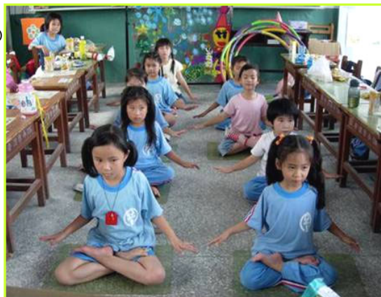
同乐会的压轴好戏——法轮功法表演

【明慧网】到了学期末，开“同乐会”是我带班的惯例。孩子们纷纷贡献所长：唱歌、单脚旋转、叠罗汉。孩子三三两两的发表意见，似乎不够热络。当我问到“有没有人要表演炼功呢？”一只、两只、三只……哇！全班只有十六个人，居然有近十只小手举了起来，并大声的高喊着“我要！”于是，功法表演成了这次同乐会的压轴好戏。