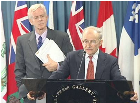
麦塔斯（发言者）和乔高在新闻发布会上

【明慧网】由加拿大前亚太司司长、资深国会议员大卫·乔高和国际人权律师大卫·麦塔斯组成的独立调查组 2006 年 7 月 6 日向加拿大媒体公开了“关于调查指控中共摘取法轮功学员器官的报告”。在当天的新闻发布会上，麦塔斯将活体摘取法轮功学员器官的行为称为“这个星球上前所未有的邪恶”。