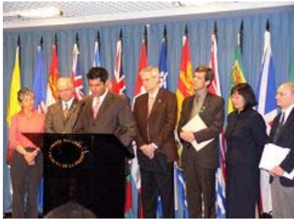
加拿大保守党联席会主席雷汉姆-杰福 雷汉姆-杰福（中）

2006年7月6日加拿大的乔高和麦塔斯发表“关于调查指控中共摘取法轮功学员器官的报告”，认为活体摘取法轮功学员器官的行为是“前所未有的邪恶形式”的结论。7月13日，加拿大保守党联席