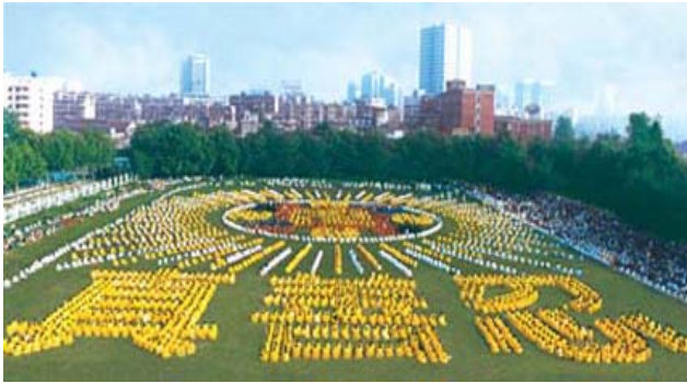
历史图片：1997，湖北省武汉市，由 5000 多法轮功学员集体炼功，组成“法轮图形”和“真善忍”

好了都意识不到。关贵敏说，在国内时，是觉得活得郁闷别扭，但并没有感觉太大的不对劲。出来一看，才知道生活在国内即便有锦衣玉食，也是非常的悲哀，因为人们的思想完全被禁锢着。