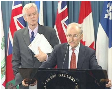
麦塔斯（右）和乔高在新闻发布会上

生的前妻的证词，那些法轮功学员最终都会被谋杀；一位中国媒体从业人员的证词；以及追查国际调查员打电话到中国医院的调查纪录。在 6 日的新闻发布会上，乔高现场为加拿大数十家媒体的记者宣读了部份电话记录。