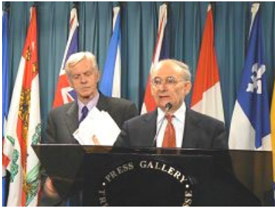
国际人权律师麦塔斯(讲话者)和乔高在新闻发布会上

2006年7月6日由加拿大前亚太司司长、资深国会议员大卫·乔高和国际人权律师大卫·麦塔斯组成的独立调查组，向加拿大媒体公开了“关于调查指控中共摘取法轮功学员器官的报告”。在当天的新闻发布会上，麦塔斯将活体摘取法轮功学员器官的行为称为“这个地球上