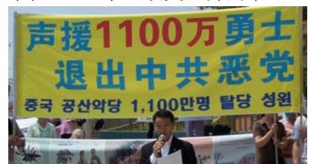
韩国声援1100万人退出中共

到2006年6月27日已超过1135万人退出共产恶党及其相关组织共青团、少先队。