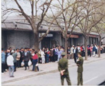
右图：和上访群众隔街相望的是中南海西门