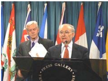
国际人权律师麦塔斯(讲话者)和乔高在新闻发布会上

2006年7月6日由加拿大前亚太司司长、资深国会议员大卫·乔高和国际人权律师大卫·麦塔斯组成的独立调查组，向加拿大媒体公开了“关于调查指控中共摘取法轮功学员器官的报告”。在当天的新闻发布会上，麦塔斯将活体摘取法轮功学员器官的行为称为“这个星球上前所未有的邪恶”。