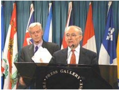
国际人权律师麦塔斯(讲话者)和乔高在新闻发布会上

2006年7月6日由加拿大前亚太司司长、资深国会议员大卫·乔高和国际人权律师大卫·麦塔斯组成的独立调查组，向加拿大媒体公开了“关于调查指控中共摘取法轮功学员器官的报告”。在当天的新闻发布会上，麦塔斯将活体摘取法轮功学员器官的行为称为“这个星球上前所未有的邪恶”。