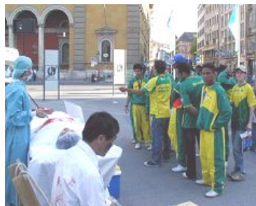
导游给巴西球迷翻译展板