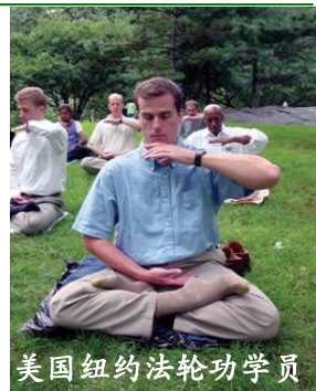
美国纽约法轮功学员

绝了,给他买了一包最好的烟,他不会抽也不要。他说“这不算什么,只要是学法轮大法的,每一个人都会这样做。”以前我不了解法轮功,听信了电视报纸的歪曲报导。这次亲身经历让我明白了,现在人群当中只有法轮功学员具有这么高尚的品德和这么美好的心灵!中共的报纸和电视都是骗我们老百姓的。◇